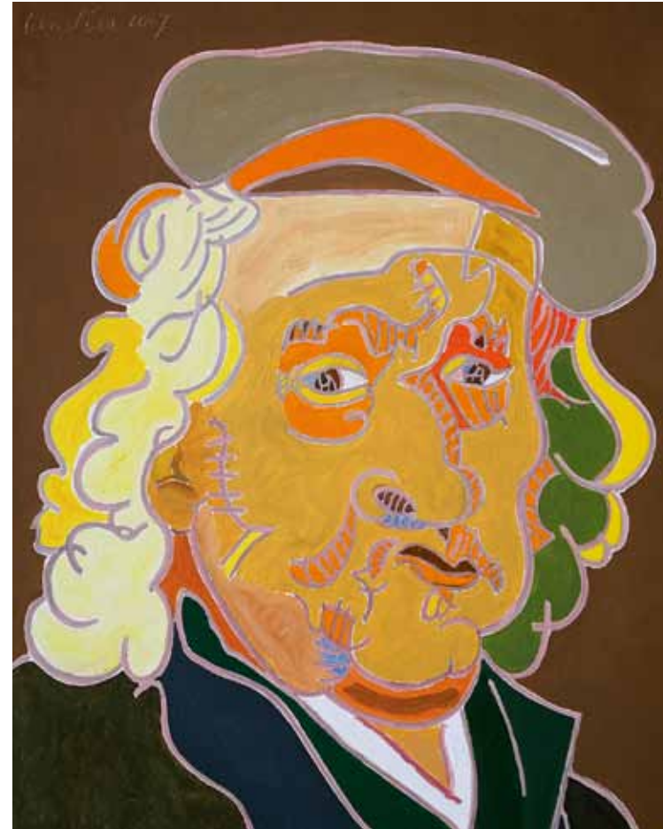
Rembrandt 1669 La Haye huile de Landier 2007 92 x 73 cm