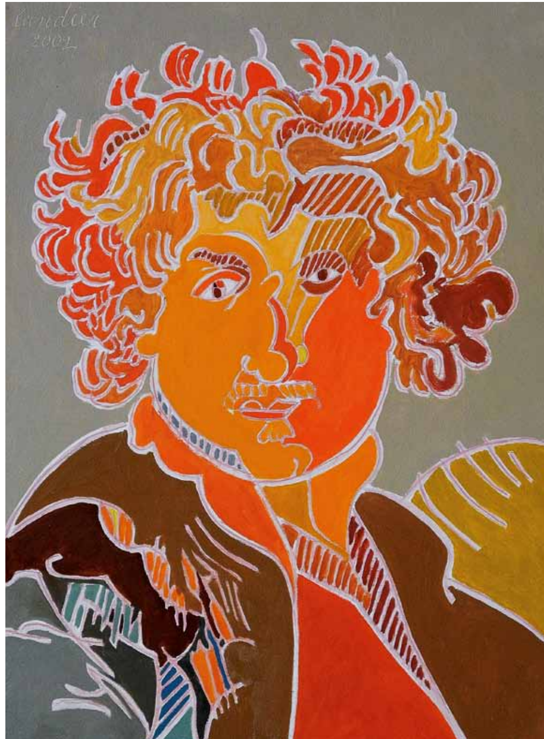
Rembrandt 1629 Londres huile de Landier 2002 73 x 54 cm