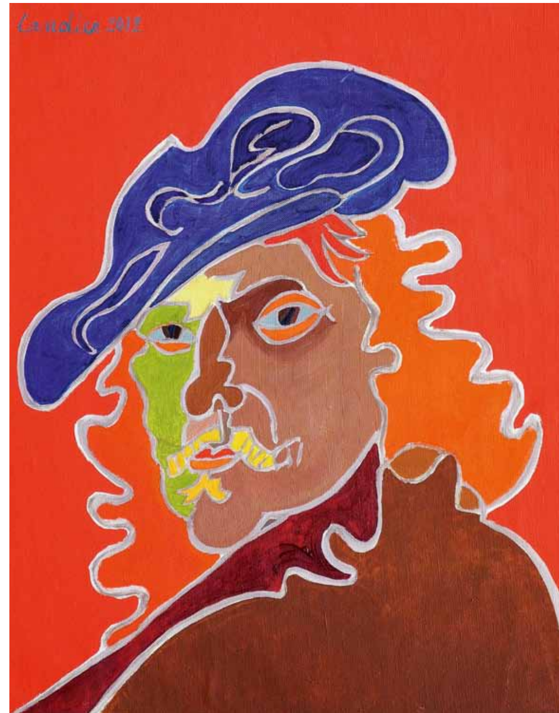
Rembrandt 1639 Amsterdam huile de Landier 2012 73 x 60 cm