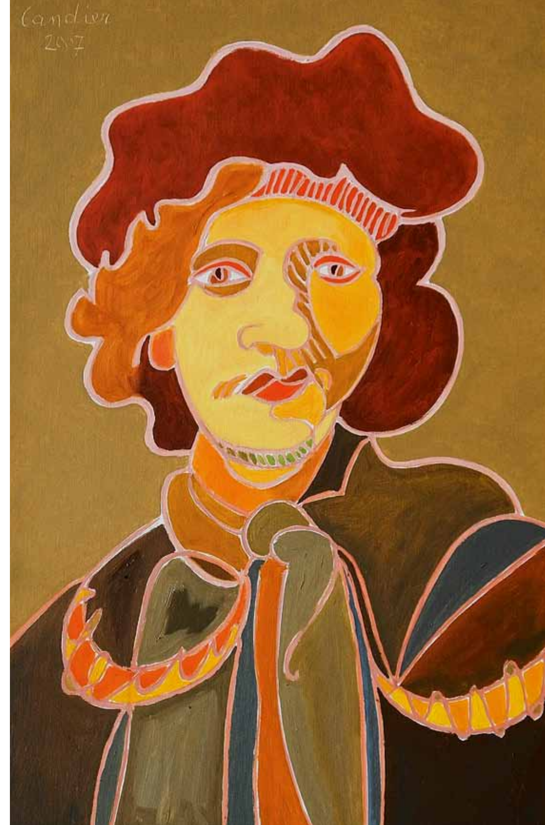
Rembrandt 1630 Liverpool huile de Landier 2007 92 x 60 cm

Now, at Henri Landier's request and to our greatest delight, they will be shown for the first time in the land of Rembrandt's birth, at TEFAF Maastricht.