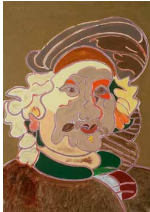
Rembrandt 1669 Londres huile de Landier 2011 92 x 65 cm