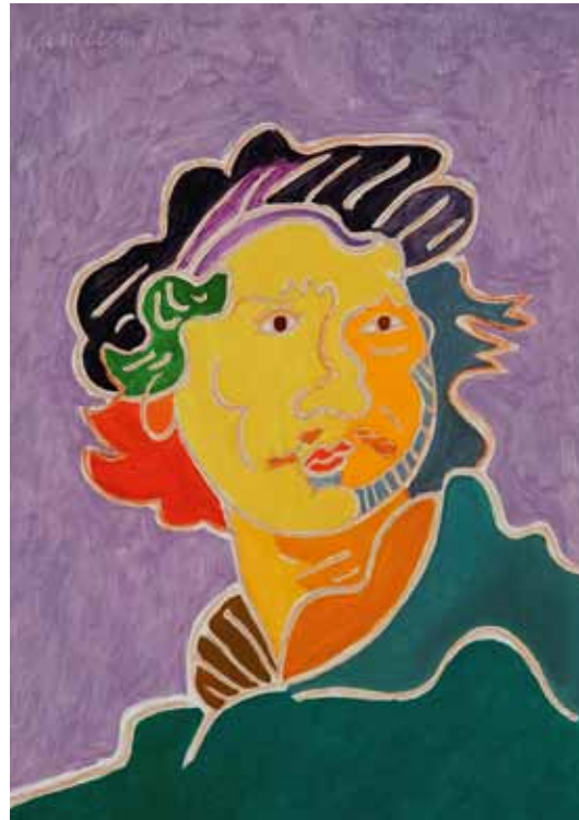
Rembrandt 1630 Amsterdam huile de Landier 2008 65 x 46 cm