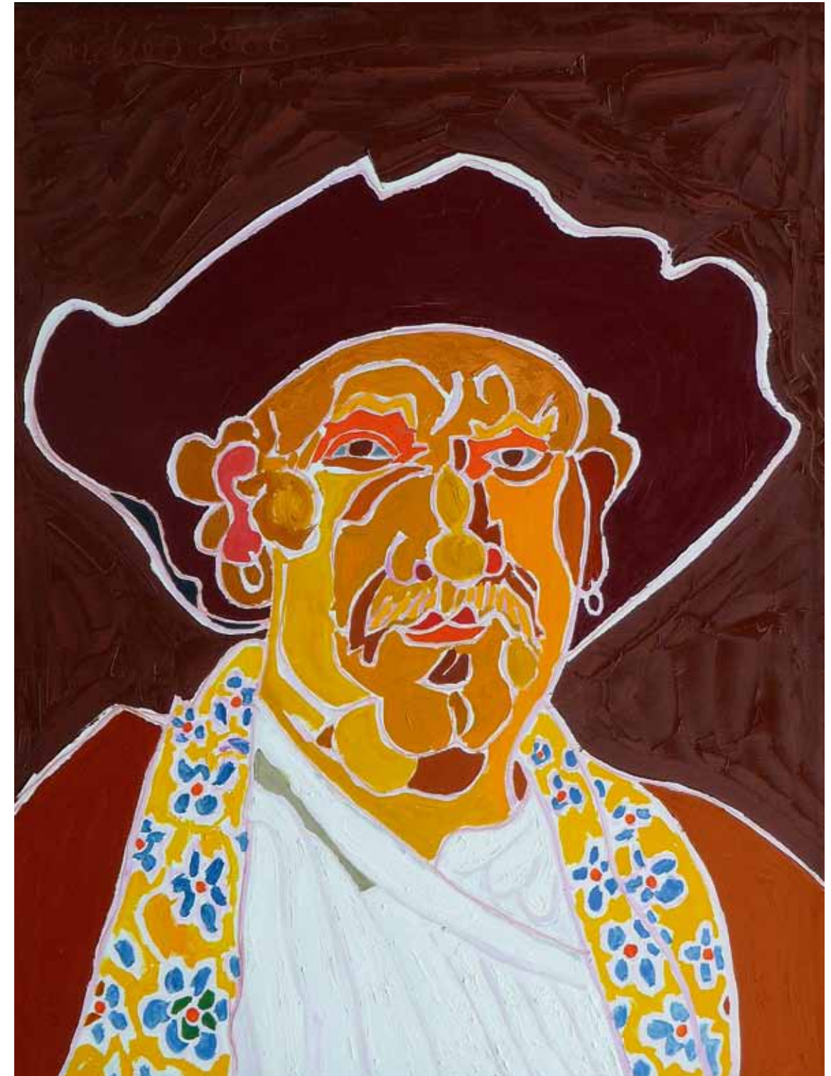
Rembrandt 1658 New York huile de Landier 2006 130 x 97 cm

Zum ersten Mal sind die Werke jetzt auf Wunsch von Henri Landier in der Stadt TEFAF ausgestellt, der Geburtsstadt Rembrandts, zum großen Glück für uns alle.