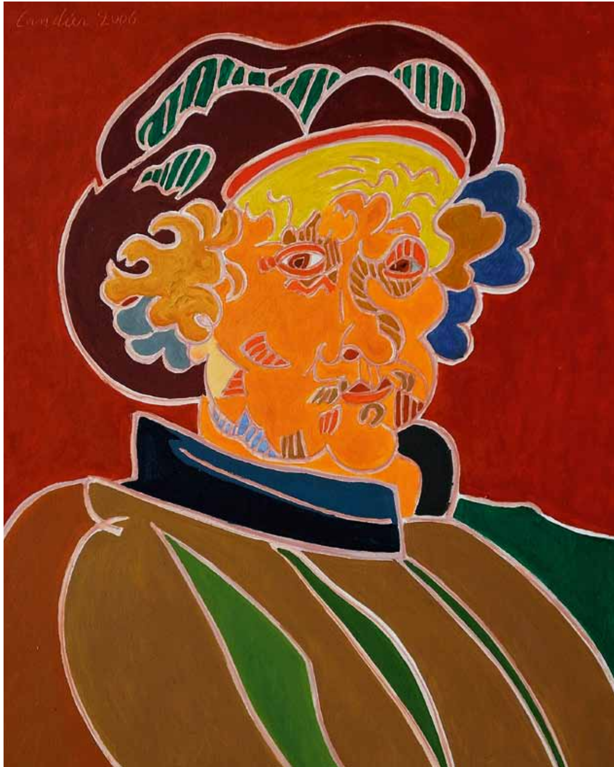
Rembrandt 1659 Edimbourg huile de Landier 2006 92 x 73 cm