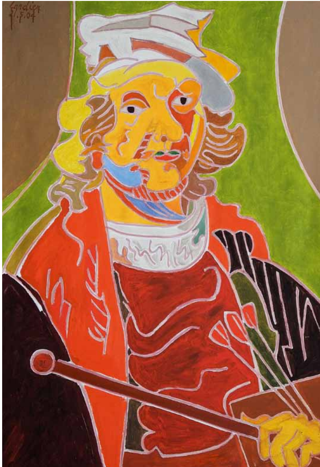
Rembrandt 1665 Londres, Kenwood House huile de Landier 2004 116 x 81 cm