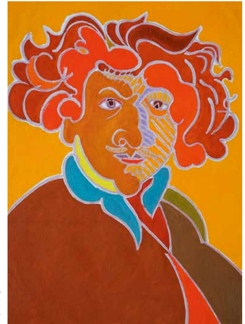
Rembrandt 1629 Londres huile de Landier 2002 73 x 54 cm