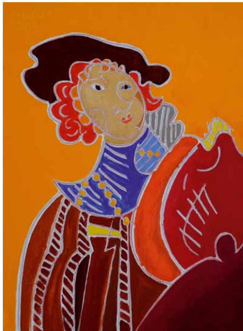
Rembrandt 1639 Florence huile de Landier 2008 73 x 54 cm