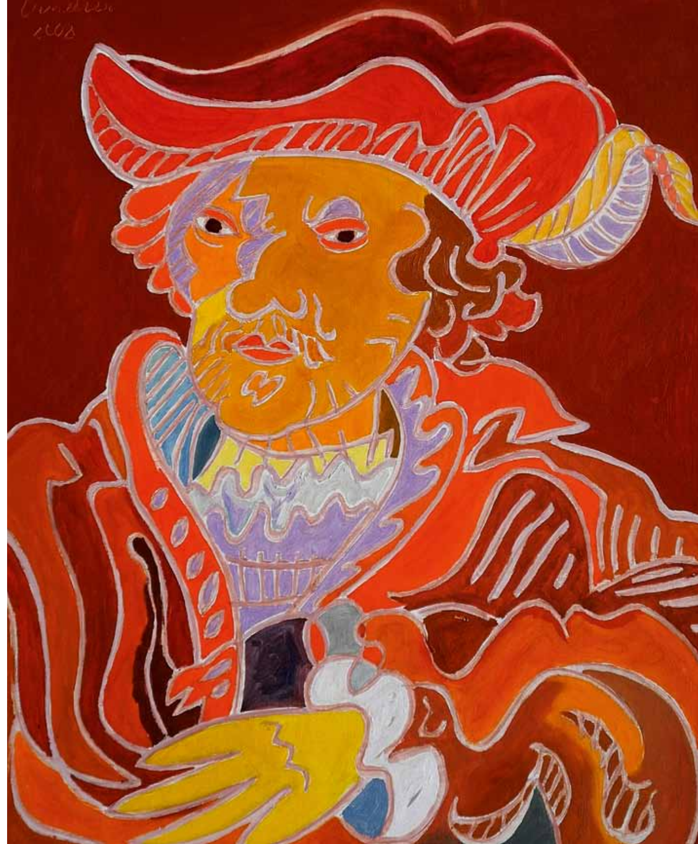
Rembrandt 1638 Amsterdam huile de Landier 2008 73 x 60 cm