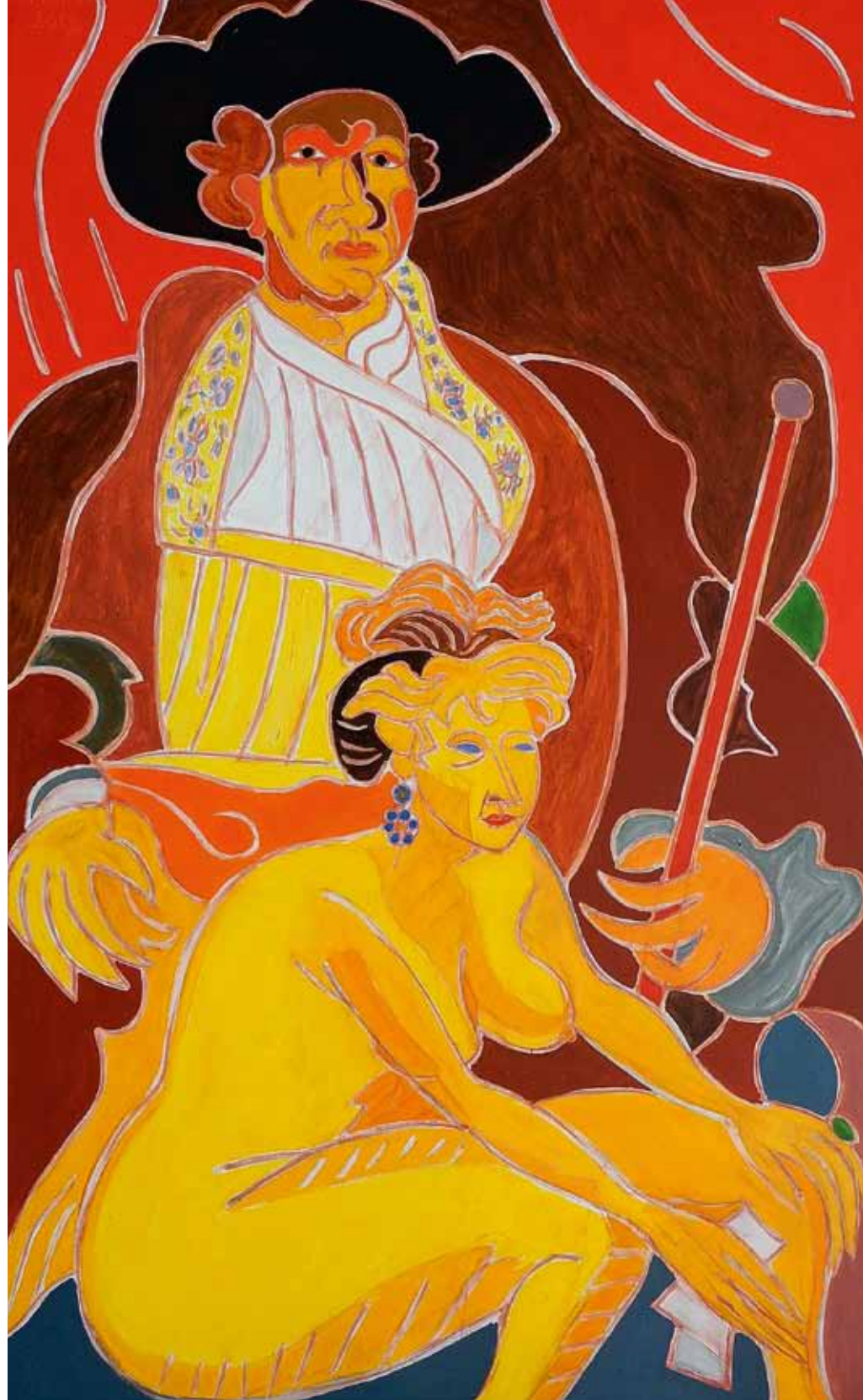
Rembrandt et Bethsabée 1654 Paris, Louvre huile de Landier 2013 162 x 97 cm