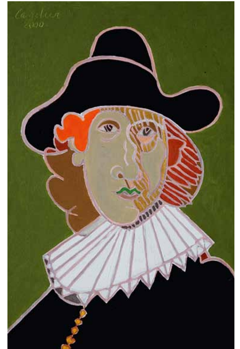
Rembrandt 1632 Glasgow huile de Landier 2000 81 x 54 cm