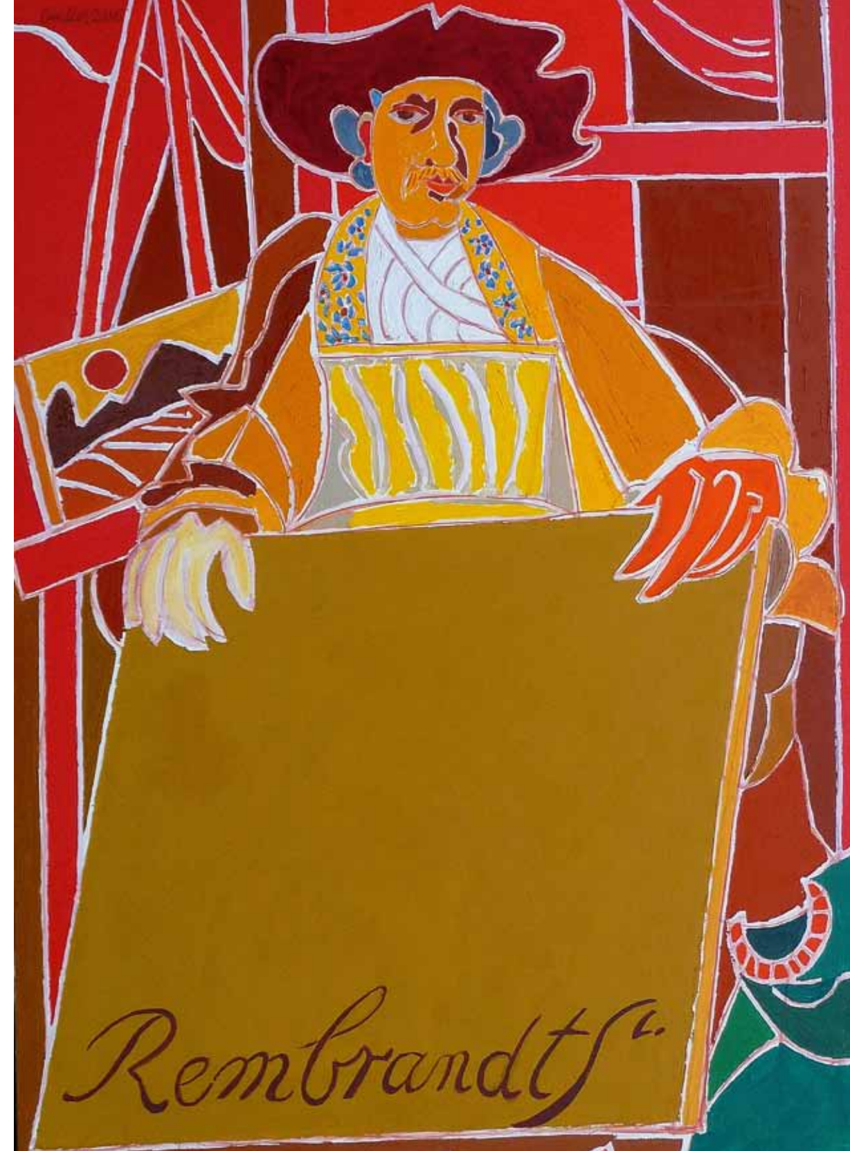
Rembrandt dans l'atelier 1658 New York huile de Landier 2006 162 x 130 cm