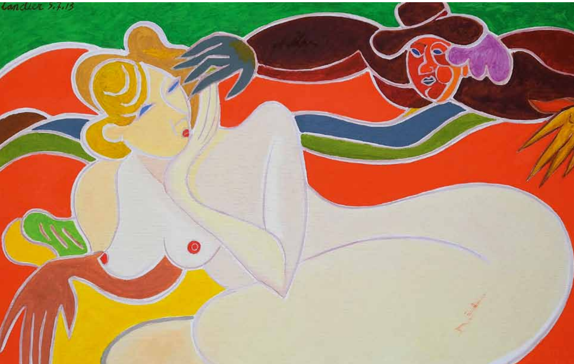
Le rêve de Saskia huile de Landier 2015 73 x 116 cm