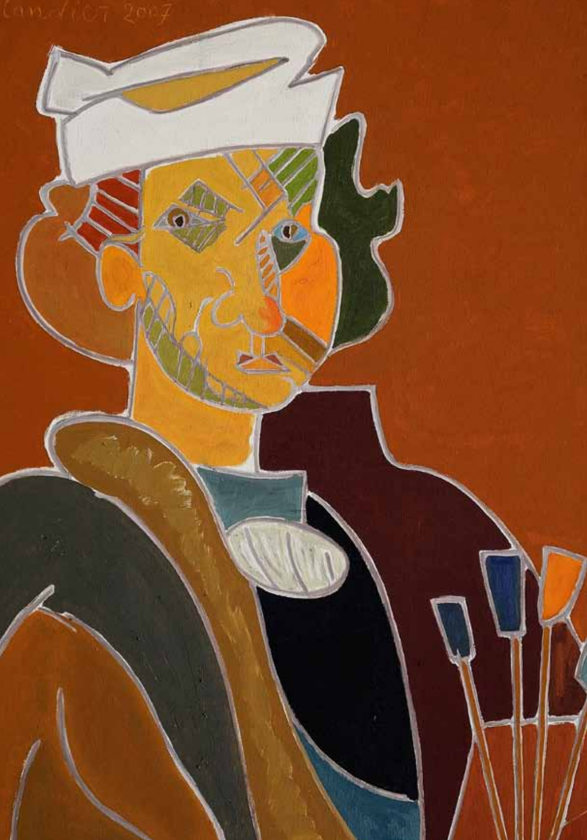
Rembrandt 1660 Paris, Louvre huile de Landier 2007 92 x 65 cm