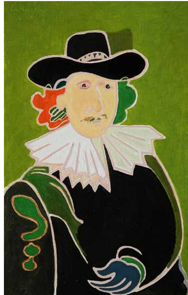
Rembrandt 1632 Collection particuliere huile de Landier 2006 92 x 60 cm