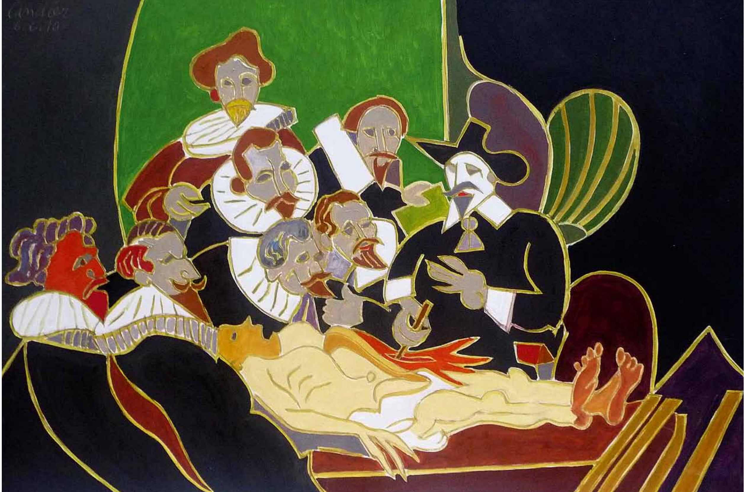
La leçon du Professeur Tulp 1632 La Haye huile de Landier 2010 89 x 130 cm