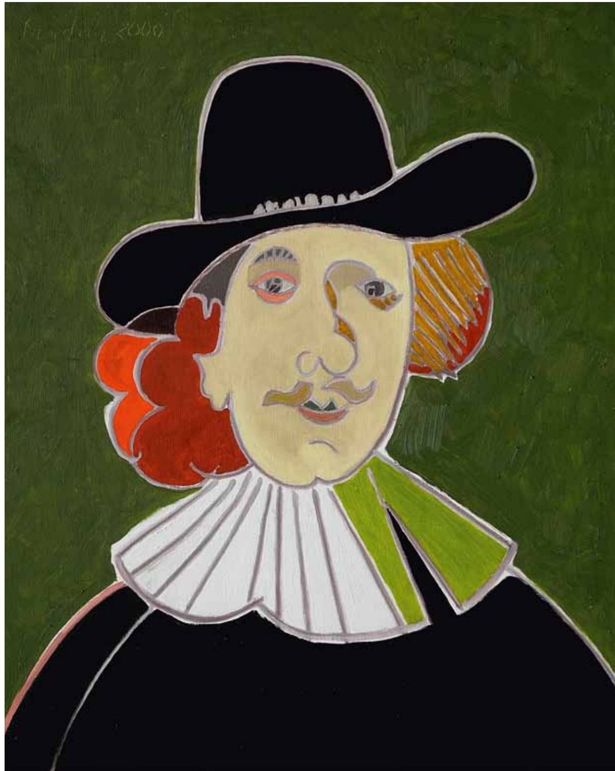
Rembrandt 1632 Collection particuliere huile de Landier 2000 81 x 65 cm