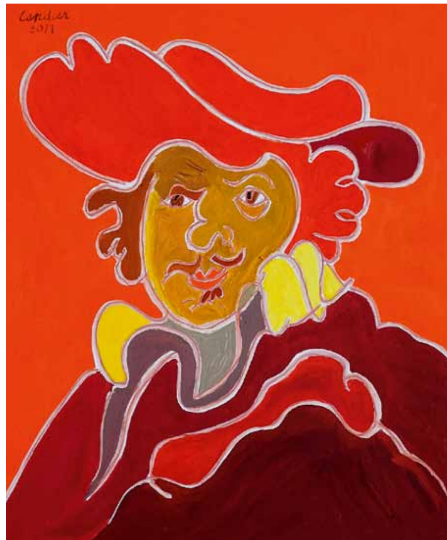
Rembrandt 1634 Berlin huile de Landier 2011 65 x 54 cm