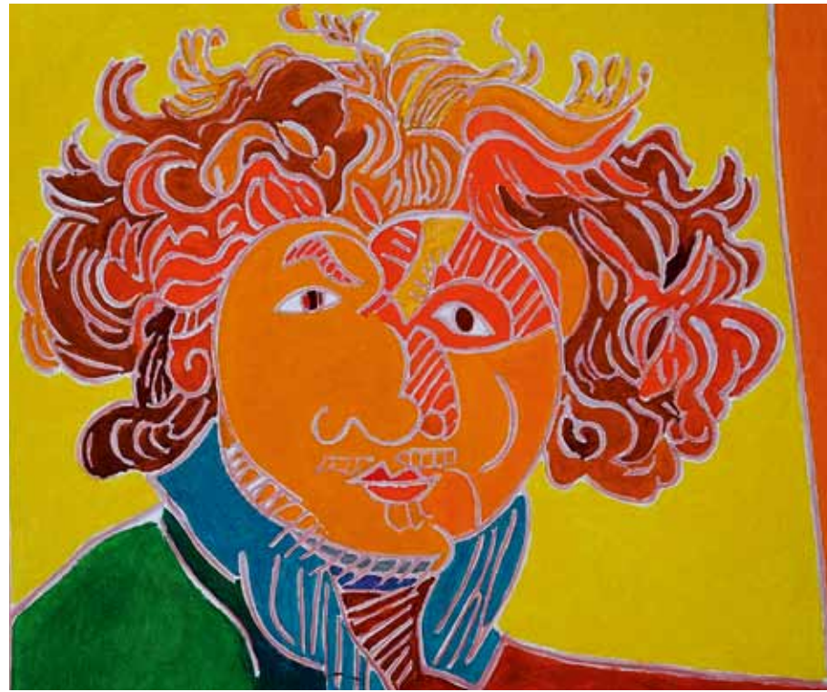
Rembrandt 1631 Amsterdam huile de Landier 2002 55 x 46 cm