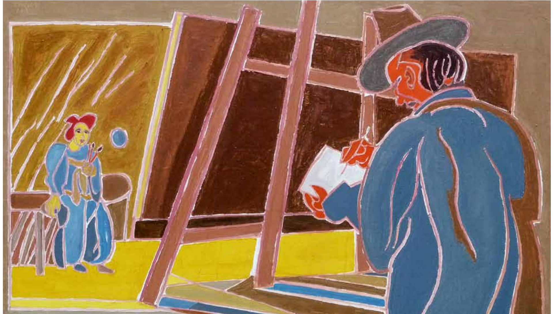
Rembrandt, le peintre dans son atelier 1629 Boston huile de Landier 2007 100 x 81 cm