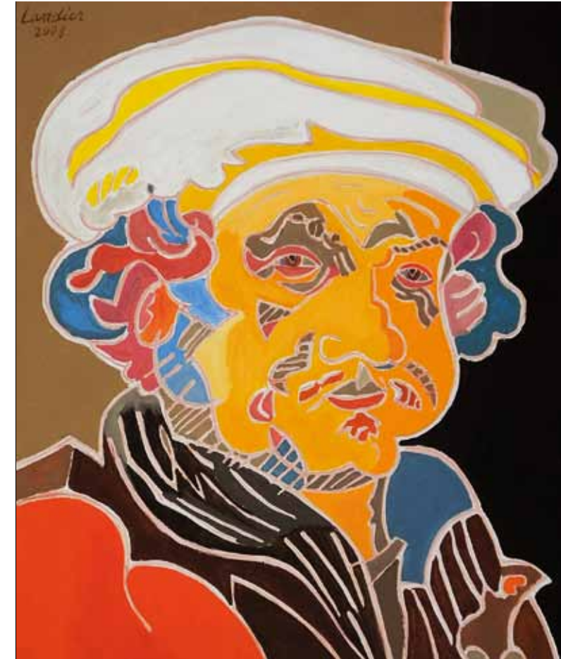
Rembrandt 1661 Amsterdam huile de Landier 2008 73 x 60 cm