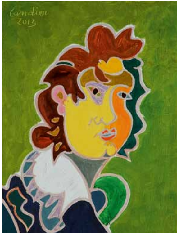
Rembrandt 1629 Munich huile de Landier 2013 46 x 33 cm