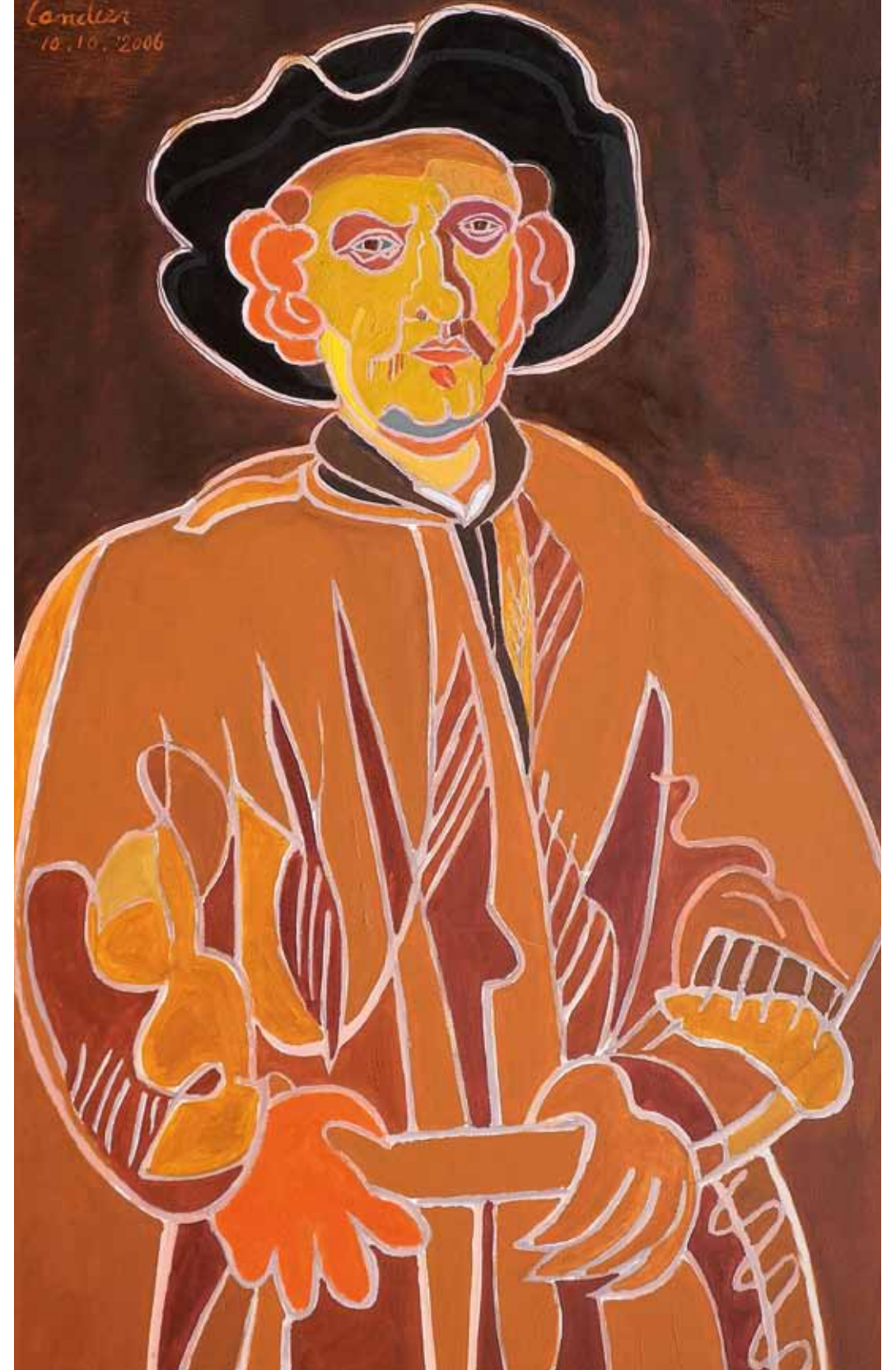
Rembrandt 1652 Vienne huile de Landier 2012 130 x 89 cm